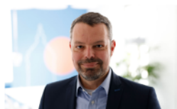
Arnd Suck Rhein-Neckar-Odenwald