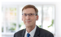
Thomas Class Ludwigsburg

Auch im Namen unserer Teams wünschen wir Ihnen viel Freude bei der Lektüre und natürlich bei der Teilnahme an unseren Veranstaltungen.